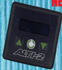
MERCURY JADE AUDIBLE ALTIMETER RECHARGEABLE BATTERY, 3 FREEFALL ALARMS & SLIM DESIGN FOR TIGHT HEADGEAR! #1 1412