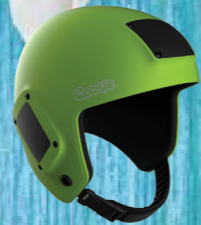
NEW! COOKIE FUEL CAMERA HEADGEAR Multiple interchangeable mounting surfaces for cameras, audibles & accessories. #L5750