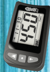
ARES II LARGE LED SCREEN, JUMP DATA, SHOCK AND WATER-PROOF #1 10939