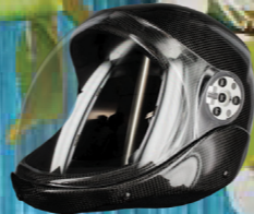
BH FUSION FLIP-FACE HEADGEAR CARBON FIBER TECHNOLOGY, FLY WITH OR WITHOUT FACE SUPER THICK LENS - SECURE LENS HINGES #L 5181