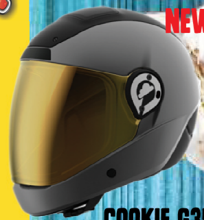
NEW! COOKIE G35 FULL-FACE HEADGEAR REPLACEABLE TOP LINER ACCESSORIES AVAILABLE COLOR LIST ONLINE #L5780