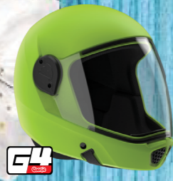
NEW! COOKIE G4 FULL-FACE HEADGEAR CERTIFIED TO XP S 72-600 ACCESSORIES AVAILABLE TUNNEL SAFE - COLOR LIST ONLINE #L5744