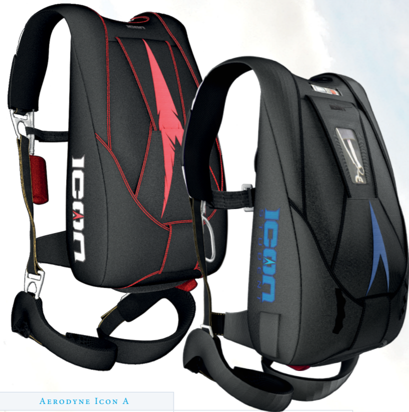
AERODYNE ICON A