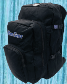
PARAGEAR GEARBAG THE BEST PLACE TO CARRY YOUR GEAR CORDURA PLENTY OF ROOM TO CARRY YOUR RIG, LOGBOOK, JUMPSUITS AND MORE! #112445