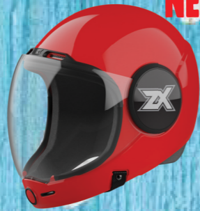
NEW! PARASPORT ZX FULL-FACE HEADGEAR FULL-FACE & LENS FLIP UP, COLOR LIST ONLINE #L5085