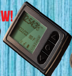
NEW! ATLAS II AUDIBLE/VISUAL ALTIMETER RECHARGEABLE, LOGBOOK, 8 ALARM GROUPS, JUMP DATA #1 1429