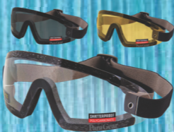
PG CURVE GOGGLE SKYDIVING GOGGLE CURVED SCRATCH RESISTANT LENS, GOGGLE BAG, COMES IN CLEAR, YELLOW AND SMOKE TINTED LENS #G1187